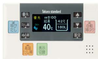
自動湯はりタイプ用フロコントローラ EMS-A-CS