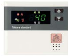
自動湯はりタイプ用メインコントローラ EMS-C-1